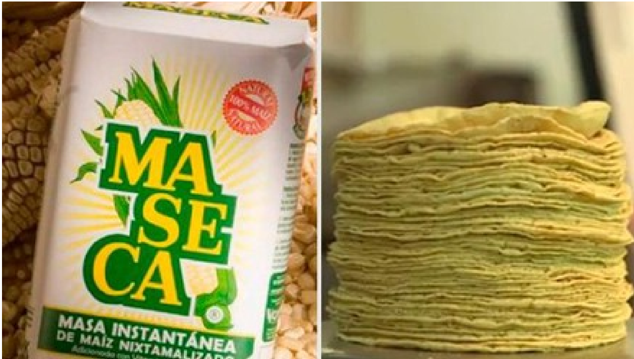
| MASECA (MASECA)

El 70 por ciento restante de la tortilla en México se hace con la tradicional masa de nixtamal y bajo la distribución de cientos de tortillerías a lo largo del país.