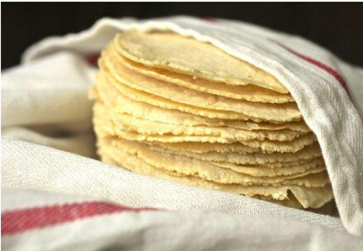
| TORTILLAS ELABORADAS DE HARINA DE MAÍZ

En ese contexto, los expertos consideraron que el anuncio del presidente AMLO con respecto al respaldo de Maseca para no aumentar el precio de sus productos por casi medio año es un factor positivo que ayuda de manera relevante al bolsillo de los mexicanos.