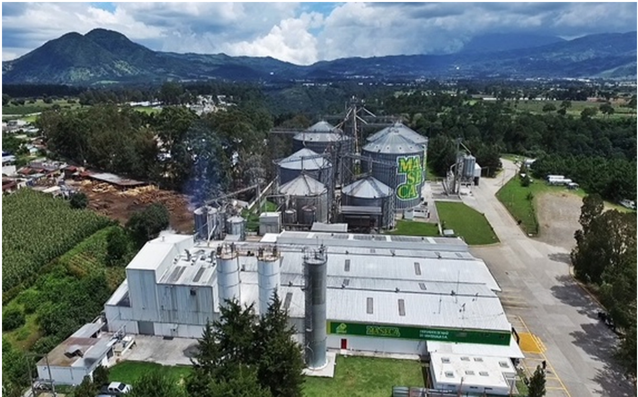
Gruma ha tenido resultados favorables, pese a pandemia de covid-19. (Especial)

Este alimento propio de la gastronomía mexicana, así como algunos de sus derivados - totopos, tostadas y frituras- han conquistado los paladares de los consumidores más exigentes en el mundo, entre ellos los jeques árabes.